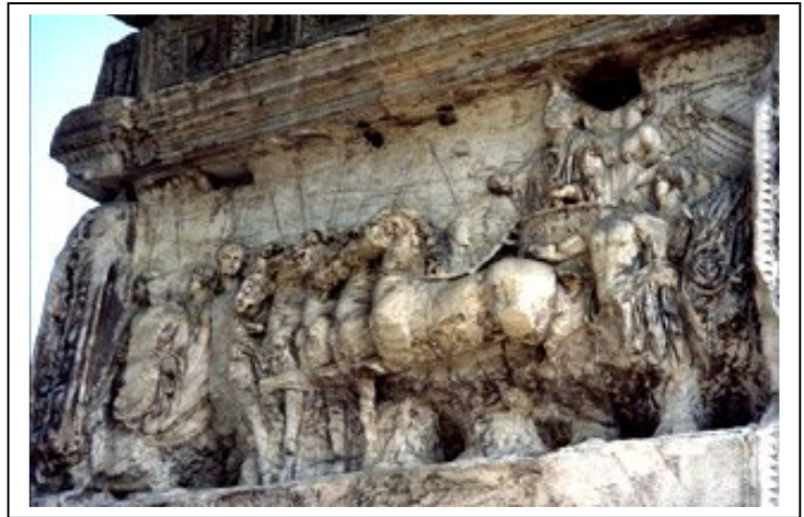
Particolare del lato interno destro