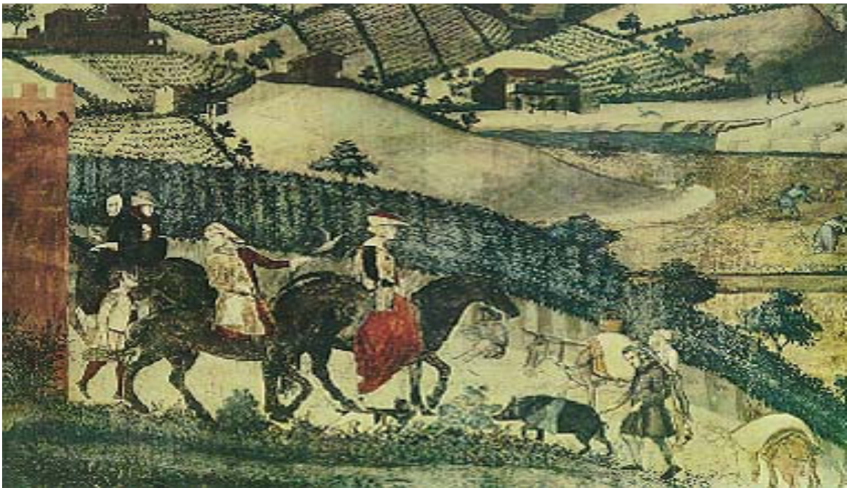
Particolare del corteo dei cavalieri nel Buongoverno in campagna