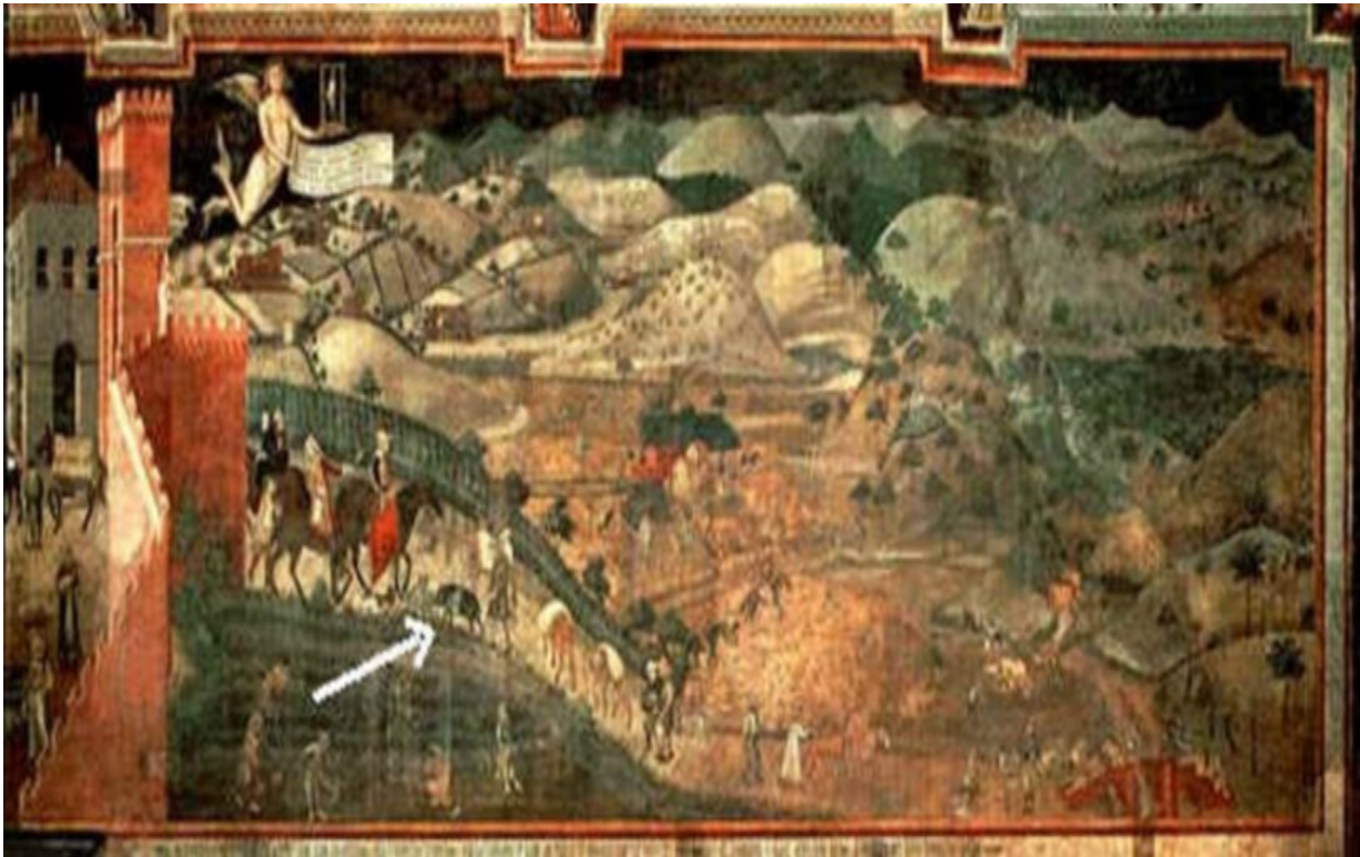
Parte destra dell'affresco: Buongoverno in campagna