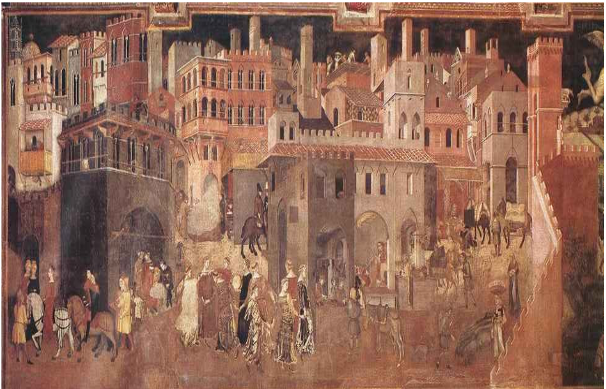
Parte sinistra dell'affresco: Buongoverno in città